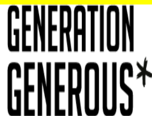
Generation Generous – Ηνωμένο Βασίλειο