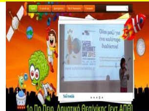
1 ο Πρότυπο Πειραματικό Δημοτικό Θεσ/νίκης-Ελλάδα