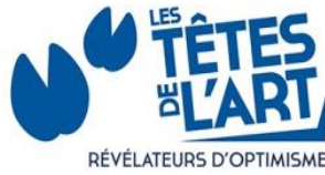
Les Têtes de l'Art – Γαλλία