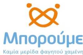
Μπορούμε – Ελλάδα