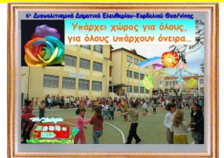
6 ο Διαπολιτισμικό Δημοτικό Ελ.-Κορδελιού- Ελλάδα