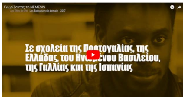
Δείτε ένα ολιγόλεπτο βιντεάκι (διάρκεια 2:28): Γνωρίζοντας το NEMESIS