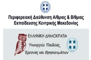
Περιφερειακή Δ/νση ΠΕ & ΔΕ Κ. Μακεδονίας – Ελλάδα