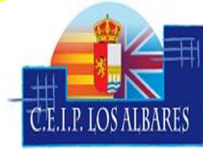
CEIP Los Albares – Ισπανία