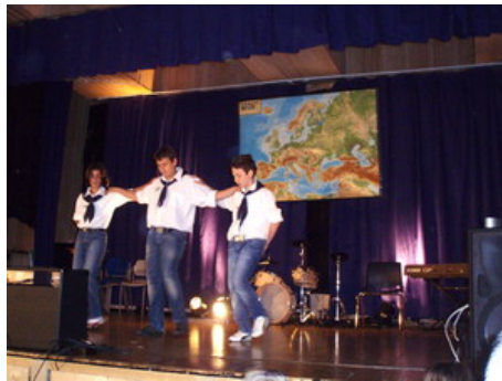
The greek boys χορεύουν χασάπικο