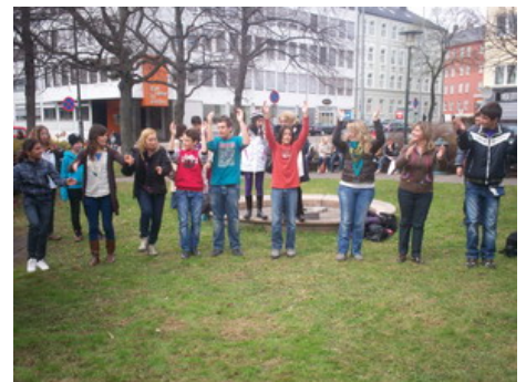
Οι Πορτογάλοι δείχνουν ένα παραδοσιακό παιχνίδι