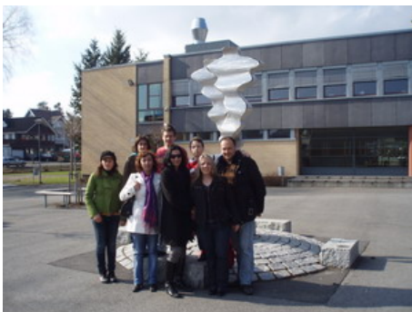
Η ελληνική αποστολή στη Νορβηγία