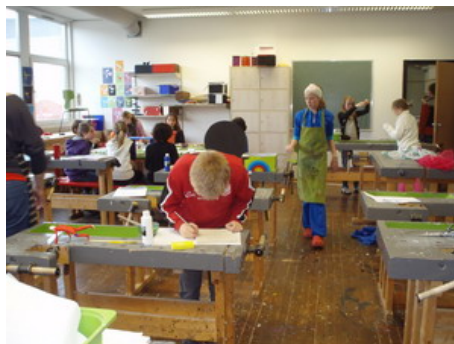
Η αίθουσα τεχνικών του σχολείου