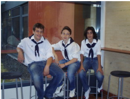
Στιγμές χαλάρωσης πριν το χορό