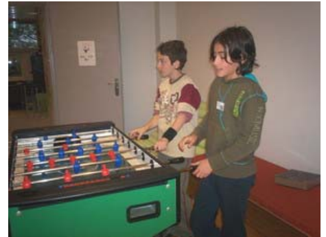
Οι μαθητές μας στην αίθουσα playroom του σχολείου