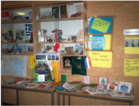
Γωνιά Comenius στο Fjellsrud skole