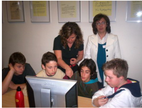
Οι μαθητές μας επί το έργο