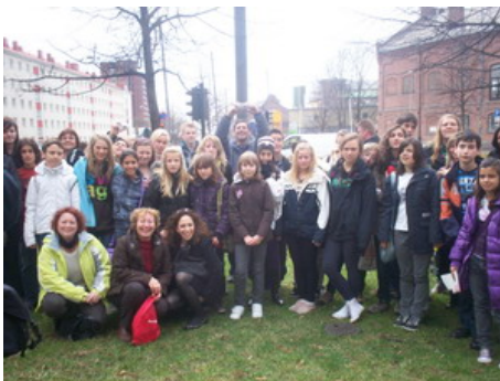
Όλη η ομάδα Comenius