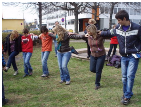
Οι μαθητές μας, διδάσκουν το χασάπικο στους ξένους