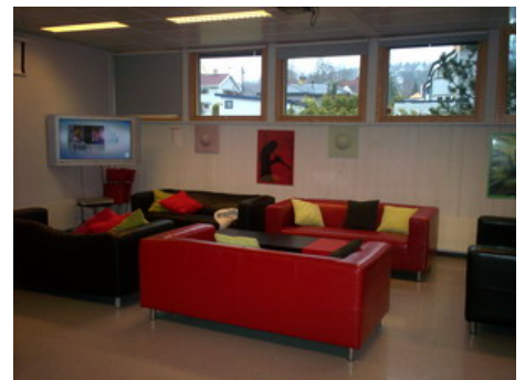
Αίθουσα χαλάρωσης μαθητών