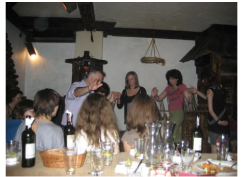
εκμάθηση ελληνικού χορού στους ξένους