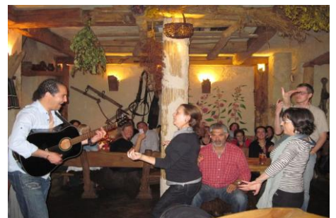
φλαμένγκο από την ισπανική αποστολή