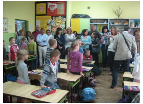
σε μια τάξη του σχολείου