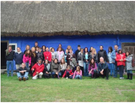
υπαίθριο εθνογραφικό μουσείο του Maurzyce