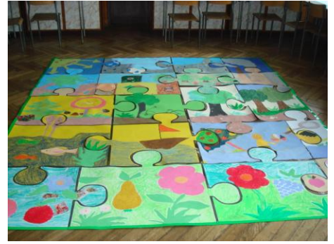
αποτέλεσμα δραστηριότητας μαθητών (παζλ)