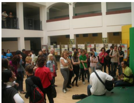
στο σχολείο της Δ.Ε.