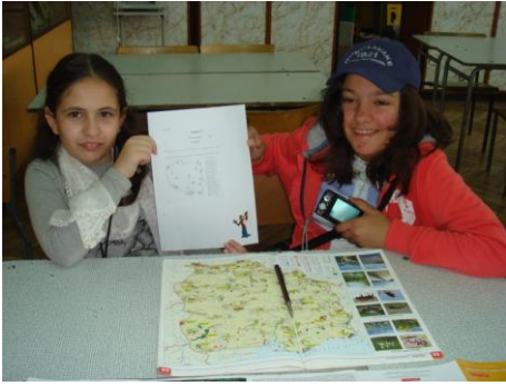
οι μαθήτριες μας σε μια δραστηριότητα