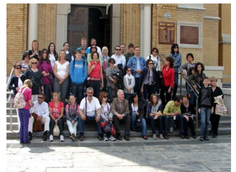
οι αποστολές μπροστά στον καθεδρικό ναό