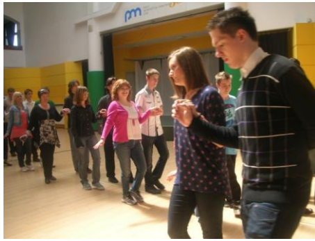
εκμάθηση πολωνικού παραδοσιακού χορού