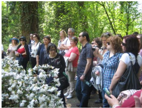
Επίσκεψη στο αλεύλλιο του Arboretum