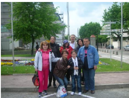
η ελληνική αποστολή στην Πολωνία