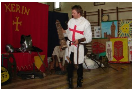
παρουσίαση του εξοπλισμού των ιπποτών