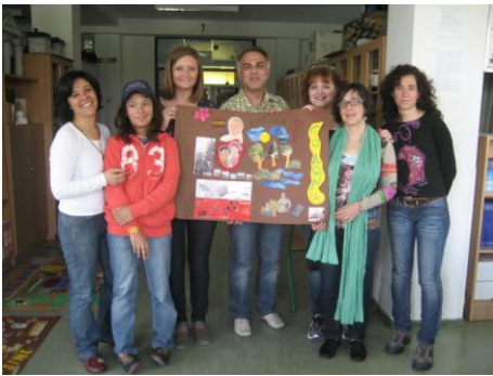
μια ελληνοϊσπανική συνεργασία