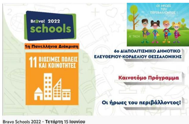
Bravo Schools 2022 - Τετάρτη 15 Ιουνίου