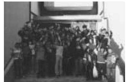
Τα παιδιά της ΣΤ' τάξης - Υπεύθυνοι Σύνταξης

Αν κάποιος επιθυμεί να επικοινωνήσει μαζί μας, μπορεί με διάφορους τρόπους: