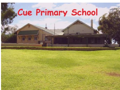
Οι Αβορίγινες της Αυστραλίας - Πίνακας Αναφοράς