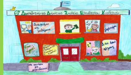
Το πρόβλημά σου πες και τη ΛΥΣΗ αμέσως ΒΡΕΣ!!!